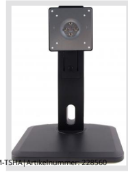
VM-TSH | Artikelnummer: 226566