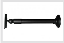
VMC-LCD/WCMB-1 | Artikelnummer: 90394